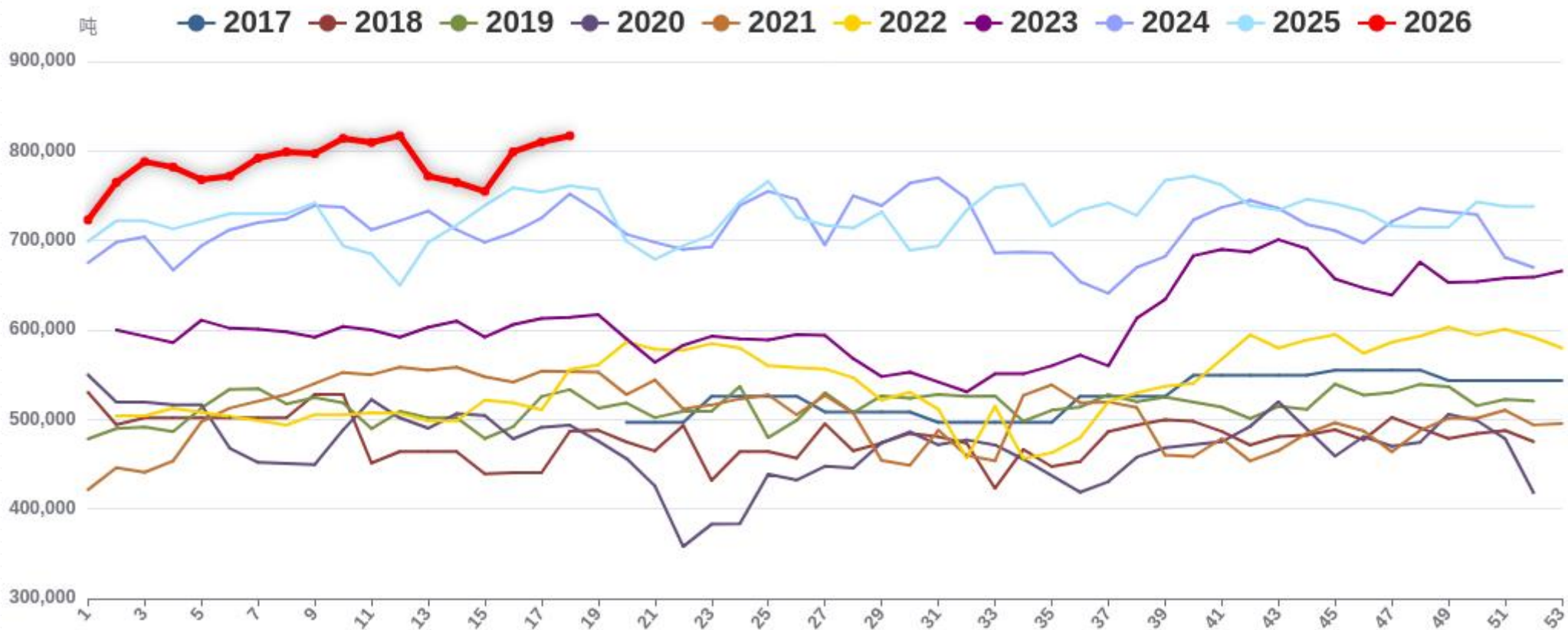
纯碱行业产量（周度）