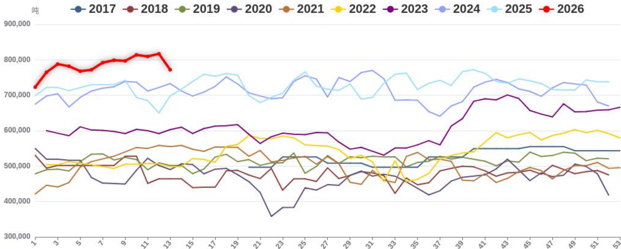
纯碱行业产量（周度）